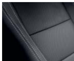
Sellerie Cuir* « Riviera » perforé, noir

Aide au parking avant et arrière avec indicateur sonore et visuel Badges extérieurs latéraux « Initiale » Coques de rétroviseurs ton carrosserie Planche de bord avec surpiqûres Projecteurs bi-xénon directionnels Rétroviseurs électriques ton caisse, rabattables et à mémorisation Sellerie Cuir « RIVIERA » perforé (noire ou beige) Sièges avant électriques et chauffants, à mémorisation côté conducteur Sur-tapis avant et arrière Volant 3 branches et pommeau de levier de vitesses gainés cuir