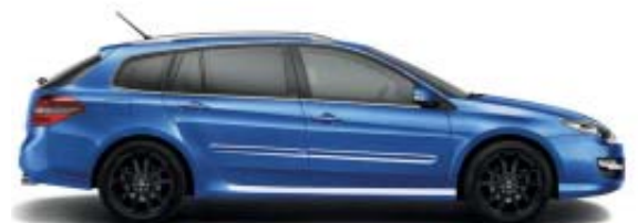
Laguna GT 4Control, avec jantes alliage 18" Interlagos noires