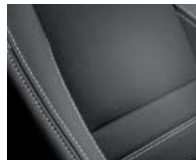
Sellerie mixte, tissu noir avec surpiqûres grises

Badges extérieurs latéraux « 4Control » Châssis 4Control (à 4 roues directrices) Décors intérieurs en aluminium véritable Jantes alliage 18" Interlagos noires Pédalier en aluminium Système de Surveillance de la Pression des Pneus