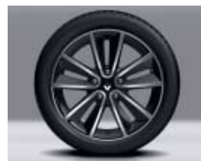
Jante alliage 17" Sari noire diamantée

Aide au parking arrière avec indicateur sonore et visuel Bornier audio numérique « Plug & Music » (Jack + USB) Carte Renault, accès et démarrage mains-libres Coques de rétroviseurs extérieurs noir nacré Frein de parking assisté Jantes alliage 17" Sari noires diamantées Lève-vitres arrière électriques impulsionnels Pommeau de levier de vitesses en aluminium (BVM) R-Link : Système multimedia 7" - Navigation TomTom® Europe Rétroviseurs extérieurs rabattables électriquement Rétroviseur intérieur jour/nuit automatique Volant GT à méplat, cuir perforé avec surpiqûres grises Vitres latérales et lunette arrière surteintées (Estate)