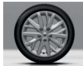
Jante alliage 16" Eptius

Système ISOFIX aux 2 places arrière Téléphonie mains-libres Bluetooth® Volant 3 branches et pommeau de levier de vitesses gainés cuir Volant réglable en hauteur et profondeur