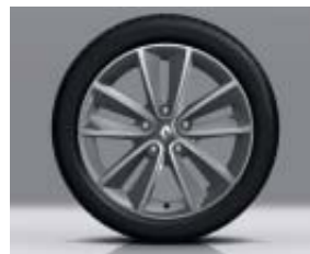
Jante alliage 17" Sari grise diamantée