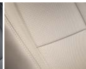
Sellerie Cuir* « Riviera » perforé, beige