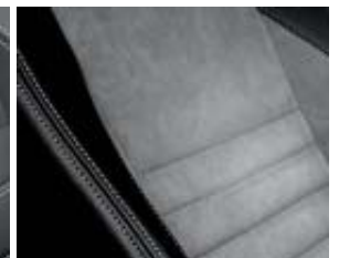
Sellerie mixte, Alcantara gris (option)