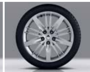
Jante alliage 18" Celsius (option)