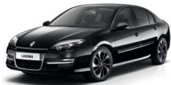
Laguna BOSE Edition avec jantes alliage 17" Akihiro